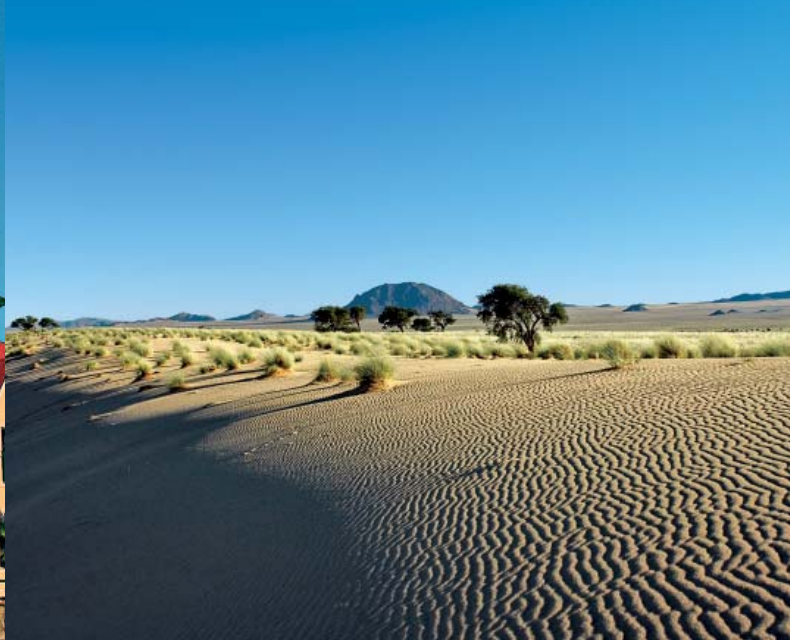
Alle Bilder dieses Folders sind urheberrechtlich geschützt.